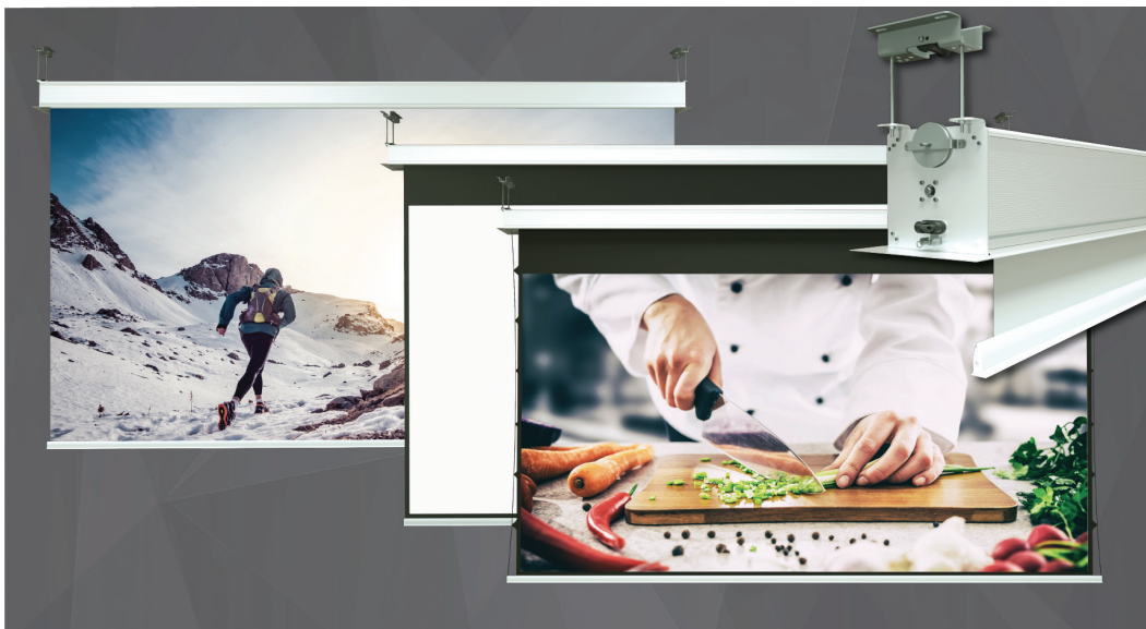
Inceiling Lodo e Inceiling Big Lodo, schermi a incasso con luce di proiezione da 4 a 8,5 metri