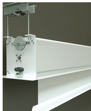
Nelle tre foto a sinistra: la novità più importante per i modelli Inceiling: il kit di sollevamento