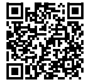
Origin Acoustics sul sito di Exertis